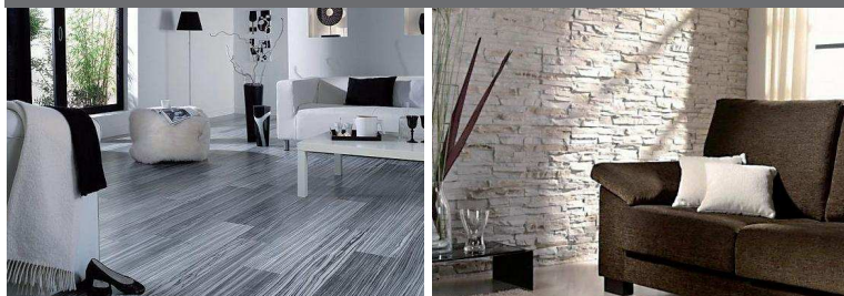
Laminatböden und Kunststeinpaneele für modernes Wohndesign.